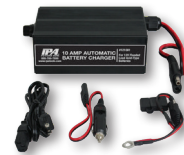
Cargador de Batería Inteligente de 10 amperios