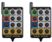
(2) Controles Remotos de 12 Botones