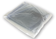
Cubierta de Lluvia