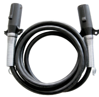
5 Pies Cable de 7 Vías