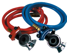
8' Manitos de Agarre